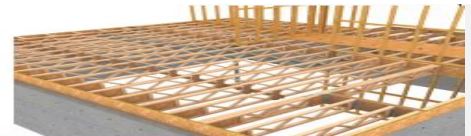
Système de plancher ajouré