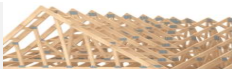
Fermes de toit

Barrette, c'est : un milieu de travail stimulant et valorisant ainsi qu'un employeur de choix offrant des conditions de travail compétitives.